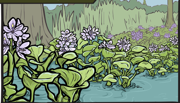
Jacinto de agua